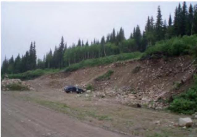
PHOTO 9 - Terrasse de kame de 8 à 10 m de hauteur adossée au roc. La face est constituée de gravier, de cailloux et de blocs soutenus par une matrice sableuse à sablo-silteuse sans structure (banc 217, gisement 142).