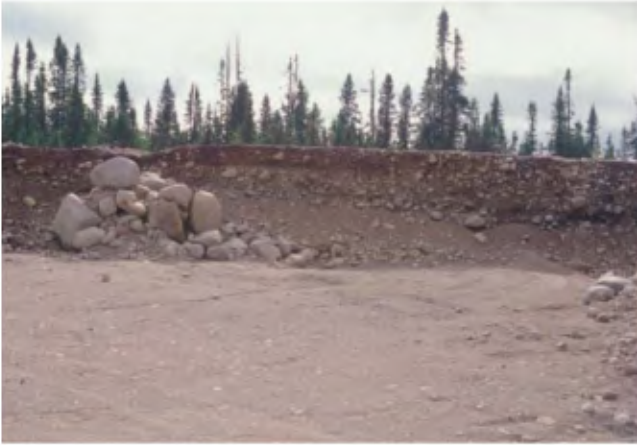
PHOTO 7 - Face de 5 à 8 m de hauteur composée de gravier (45 à 60 %) avec des cailloux (10 à 25 %) et quelques blocs. Les clastes (gravier et cailloux) sont subanguleux à subarrondis et se supportent entre eux (banc 104, gisement 109).