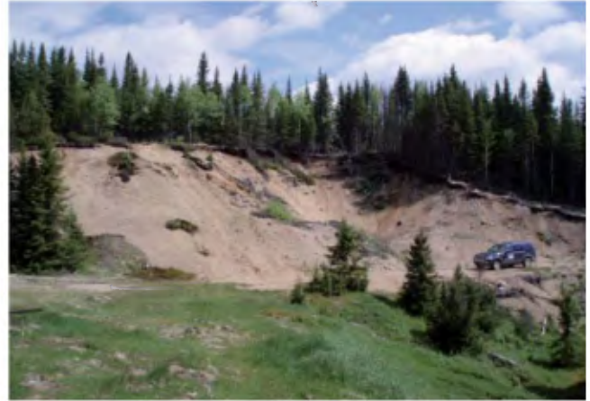
PHOTO 8 - Esker de 10 à 12 m de hauteur dans le secteur du lac Lorrain. Les faces sont formées de sable moyen stratifié avec, par endroits, des lits de gravier et de cailloux (banc 196, gisement 132).