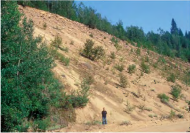
PHOTO 1 - Face constituée de 15 m de sable de granulométrie variable, plus ou moins bien stratifié, surmontée de 1 à 4 m de gravier et de cailloux (banc 13, gisement 4).