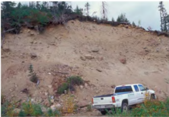
PHOTO 5 - Crête morainique de 8 à 12 m de hauteur composée de gravier et de cailloux soutenus par une matrice sablo-silteuse sans structure (banc 115, gisement 102).