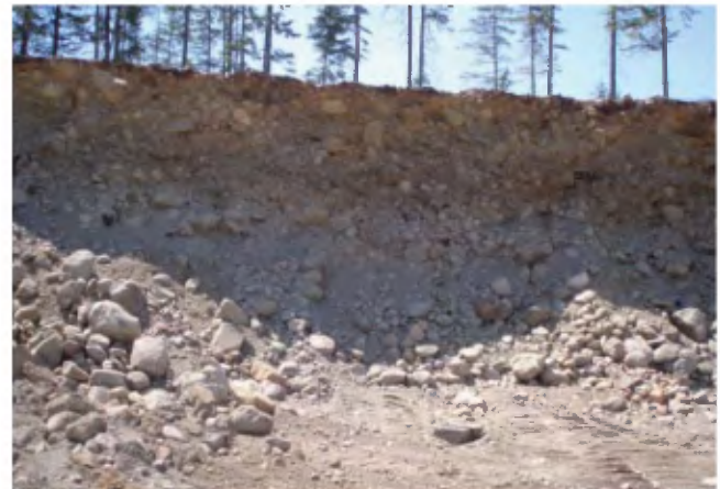
PHOTO 10 - Le banc 260 montre des faces de 3 à 6 m de hauteur. La plupart des faces sont constituées de gravier (30 à 50 %), de cailloux (10 à 20 %) et de blocs (10 à 20 %) subarrondis à subanguleux qui se supportent entre eux (banc 260, gisement 165).