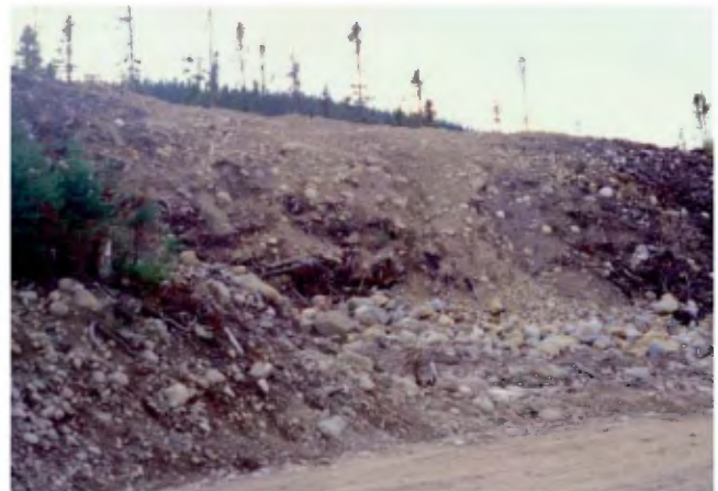
PHOTO 4 - Crête morainique constituée de gravier et de cailloux soutenus par une matrice sableuse (sable moyen à grossier) sans structure (banc 113, gisement 101).