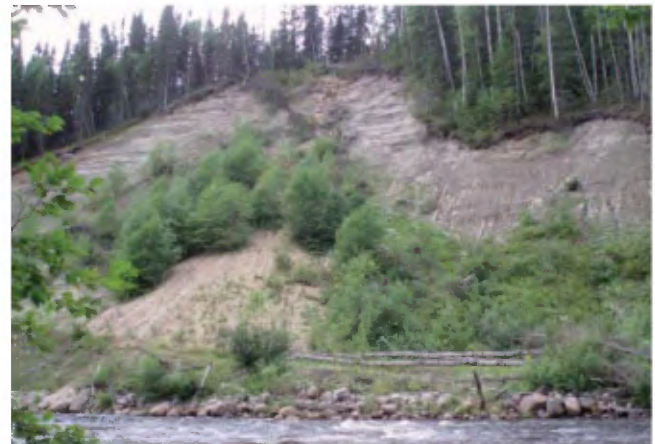
PHOTO 12 - Coupe le long de la rivière à Mars composée de 8 à 10 m de sable moyen stratifié reposant sur une unité de silt-sable rythmée dont l'épaisseur varie de 8 à 15 m (gisement 176).