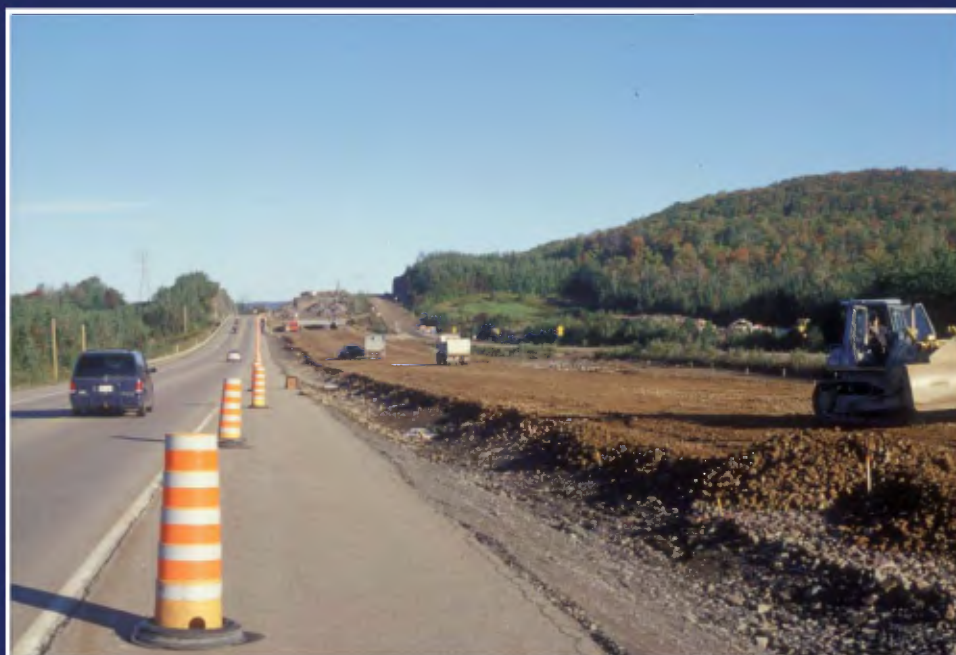
Construction de la route 175 dans la Réserve faunique des Laurentides.