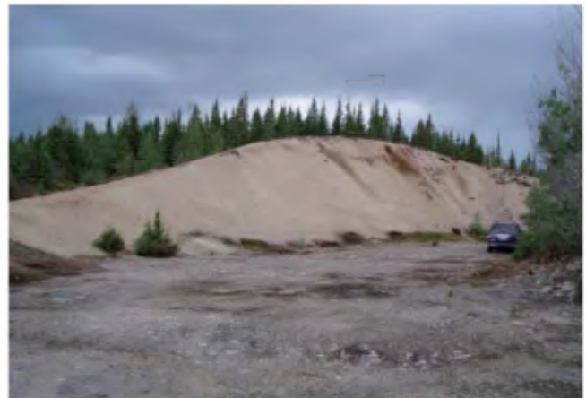
PHOTO 6 - Crête morainique remaniée en partie par les eaux glacioclastres. La crête est principalement composée de sable moyen à grossier (banc 207, gisement 107).