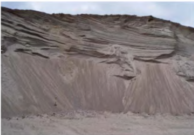
PHOTO 11 - Face de 6 à 8 m de hauteur dans un dépôt deltaïque. La face est formée de sable moyen à fin stratifié avec des lits de sable grossier et de gravier fin (banc 278, gisement 170).