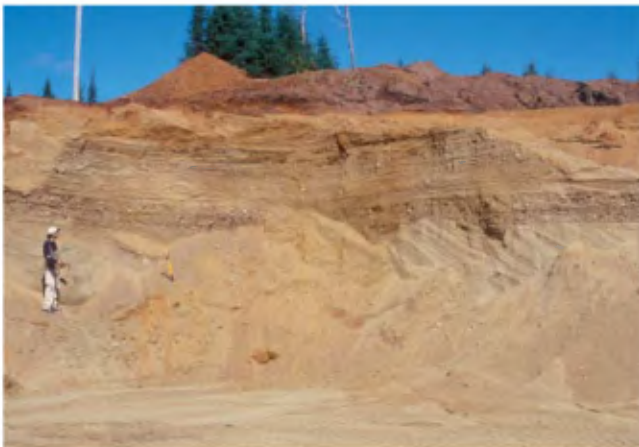
PHOTO 3 - Dépôt deltaïque constitué de 3 à 4 m de sable moyen à grossier stratifié avec du gravier et des cailloux reposant sur 3 à 4 m de sable moyen à fin présentant des stratifications obliques (banc 75, gisement 69).