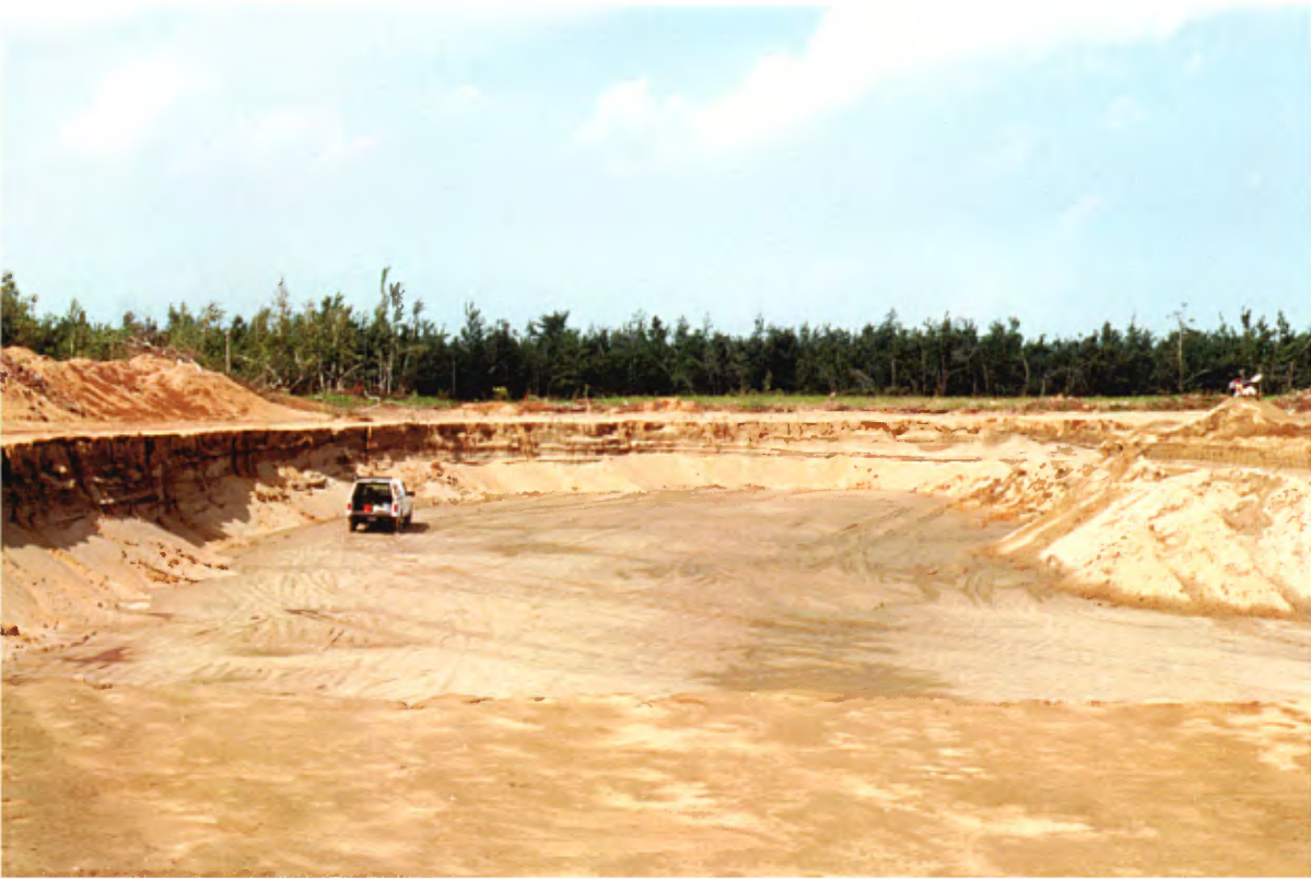
Photo 5 : Exploitation dans un vaste dépôt marin sableux typique de la région. Le dépôt, dont la topographie est plane, est composé de 5 m de sable moyen reposant sur près de 10 m de sable fin à silteux gris. La nappe phréatique affleure au plancher de l'excavation (banc 17, gisement 7).