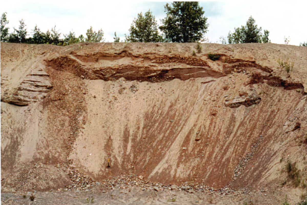
Photo 12 : Coupe de 6 à 8 m de hauteur sur le flanc d'un esker. La coupe, grossièrement stratifiée, est composée de sable de granulométries diverses avec de 10 à 25 % de gravier (banc 71, gisement 18).