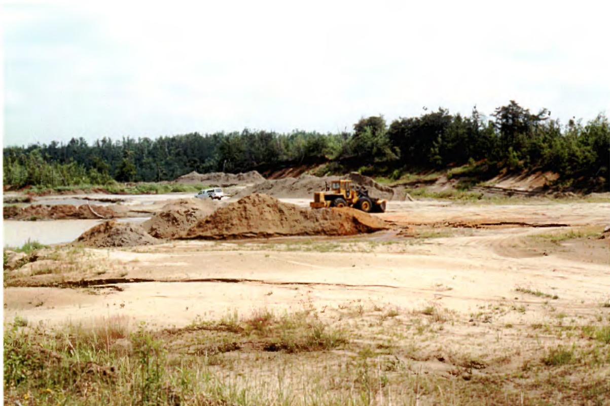
Photo 24 : Coupes de 3 à 6 m de hauteur dans un dépôt marin. Le dépôt est composé de sable fin gris avec des zones de sable moyen. La proportion de particules fines atteint souvent 10 % (banc 127, gisement 29).