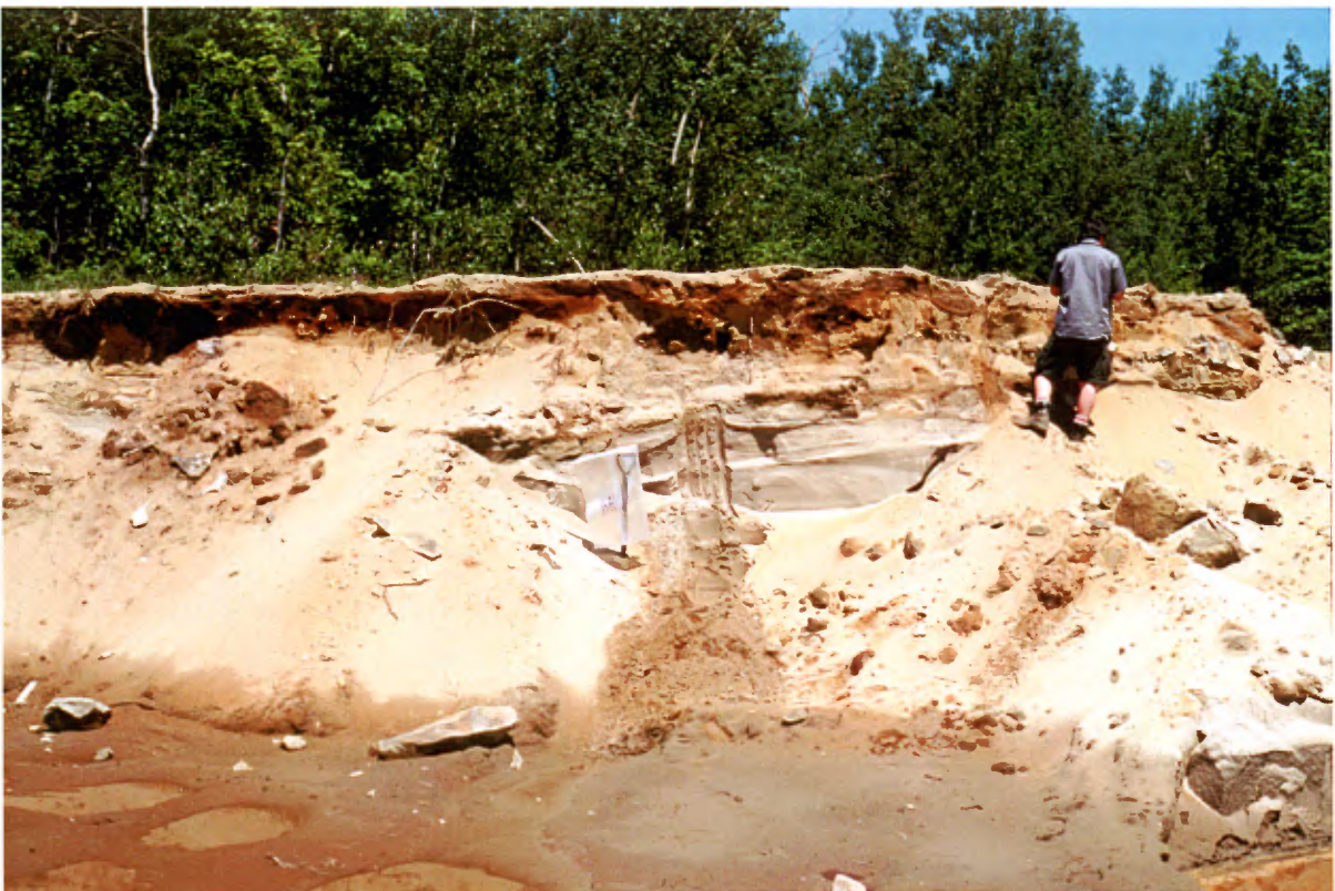
Photo 2 : Coupe de 2 à 4 m de hauteur composée de sable fin à moyen propre et lâche (banc 8, gisement 4).