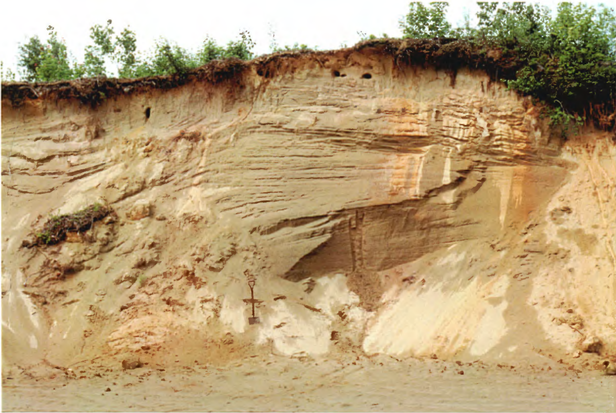
Photo 3 : Face de 5 à 6 m de hauteur formée de sable fin propre et stratifié. Passages de sable silteux en surface (banc 13, gisement 7).