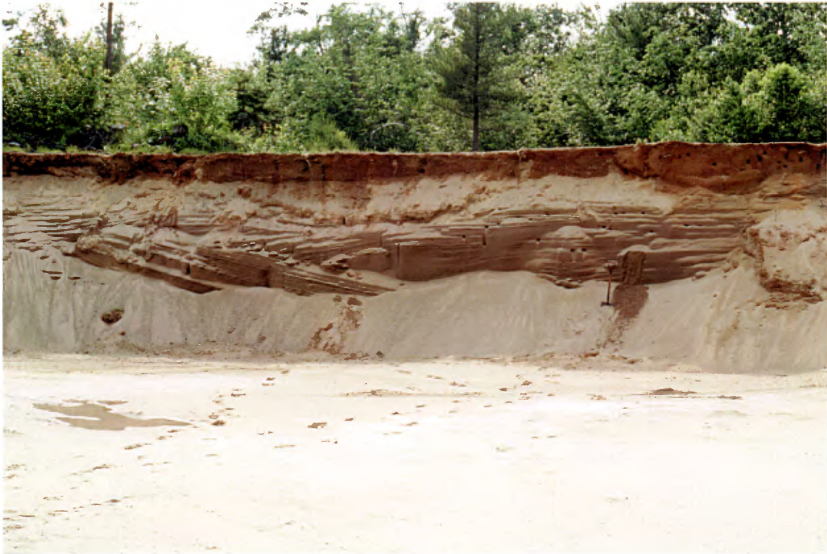
Photo 7 : Coupe de 4 à 5 m de hauteur, dans un dépôt deltaïque, composée de sable moyen à fin avec des passages de sable grossier et de gravier fin (0 à 20 %). La coupe présente des stratifications horizontales et obliques (banc 32, gisement 8).