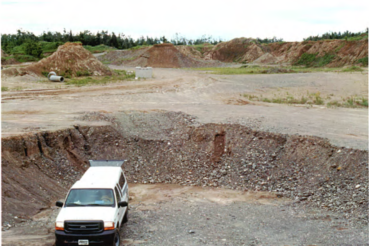
Photo 14 : Coupe de 2 à 3 m de hauteur au plancher de l'exploitation. La face est composée 40 à 60 % de gravier avec 5 à 10 % de cailloux dans une matrice de sable grossier.(banc 55, gisement 19).