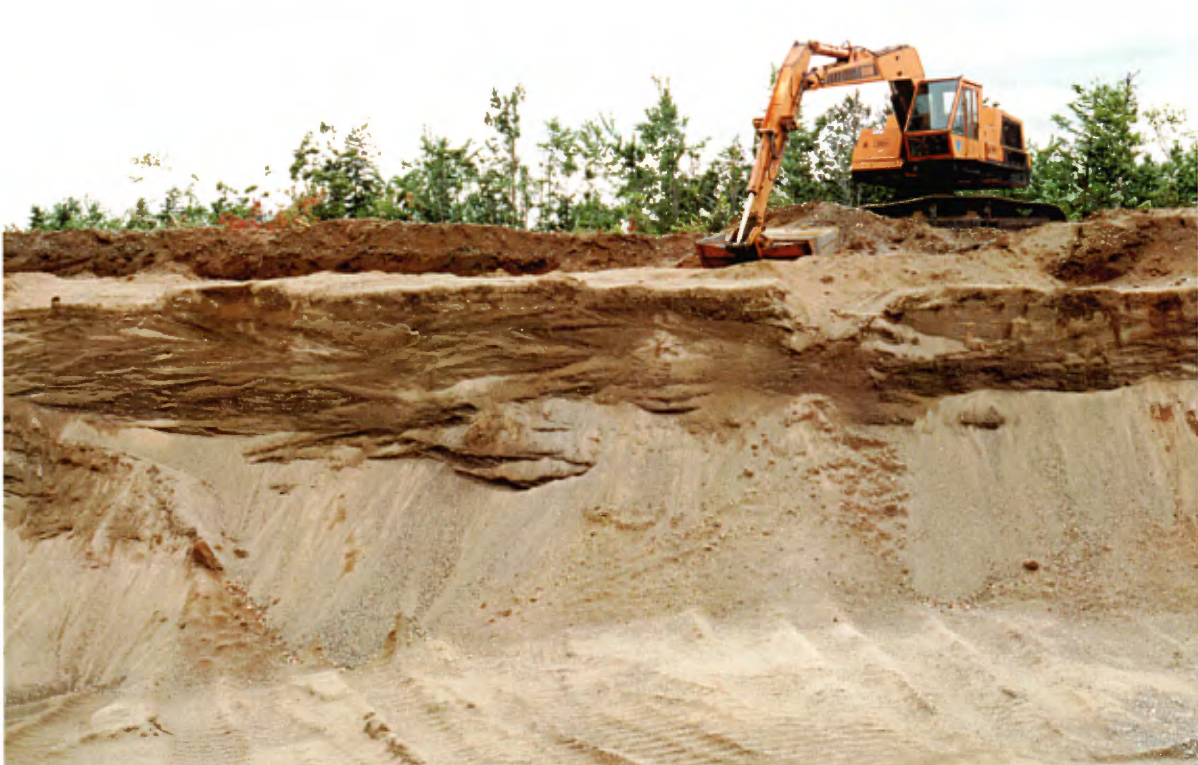
Photo 8 : Coupe de 3 à 4 m de hauteur, dans un dépôt deltaïque stratifié, composée de sable moyen à grossier et de gravier fin. Les stratifications sont entrecroisées. (banc 39, gisement 8).