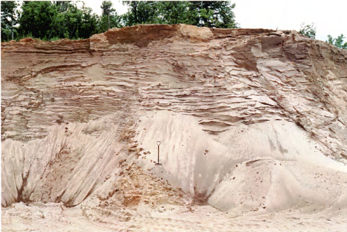
Photo 13 : Face de 5 à 6 m de hauteur dans un dépôt fluvioglaciaire stratifié. La coupe est constituée de sable fin à moyen propre et lâche (banc 55, gisement 19).