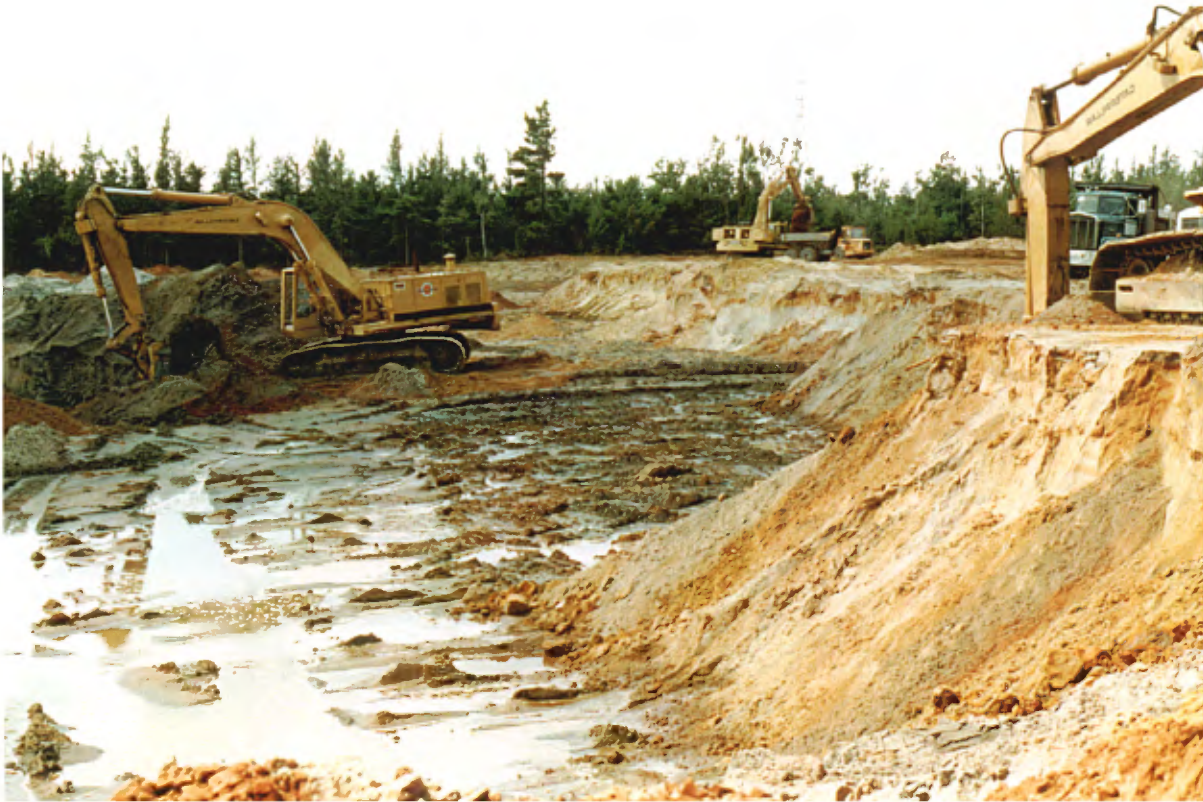
Photo 23 : Coupes de 1 à 2 m dans un dépôt marin. Ce dépôt, formé de sable moyen à fin propre, a été exploité intensivement. Les matériaux ont été utilisés comme matériaux de fondation lors des travaux de rénovation de l'autoroute 55 (banc 128, gisement 29).