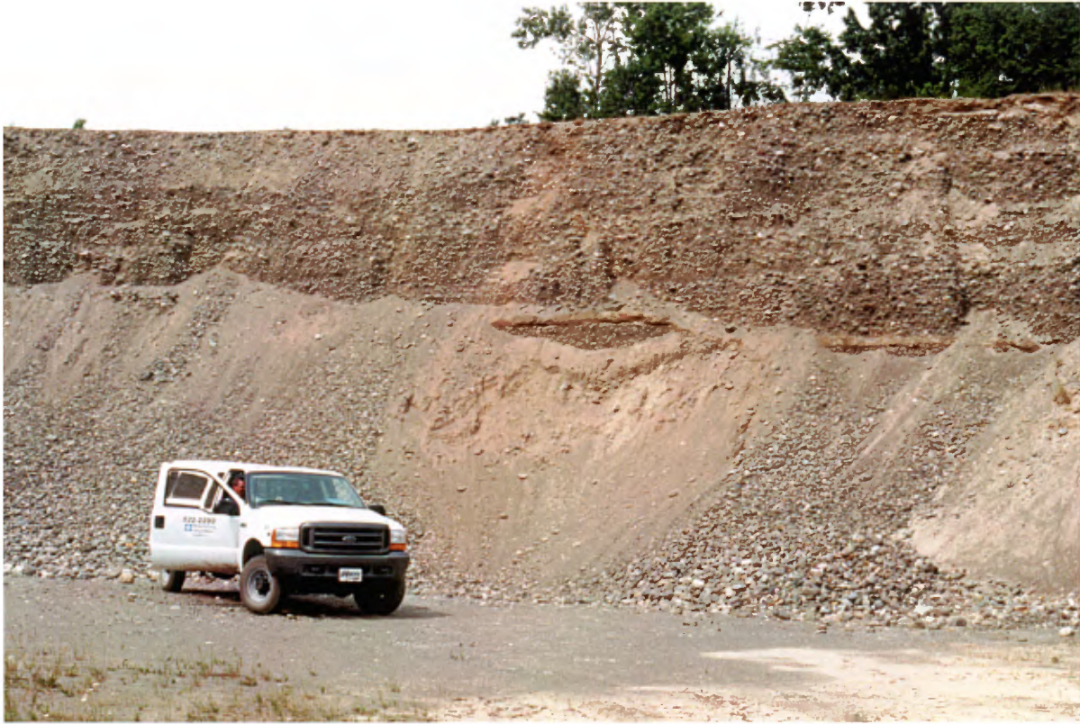
Photo 17 : Coupe de 7 à 9 m de hauteur au coeur d'un esker. La coupe est constituée de 50 à 70 % de gravier et de 5 à 15 % de cailloux entremêlé à une matrice de sable moyen à grossier (banc 116, gisement 26).