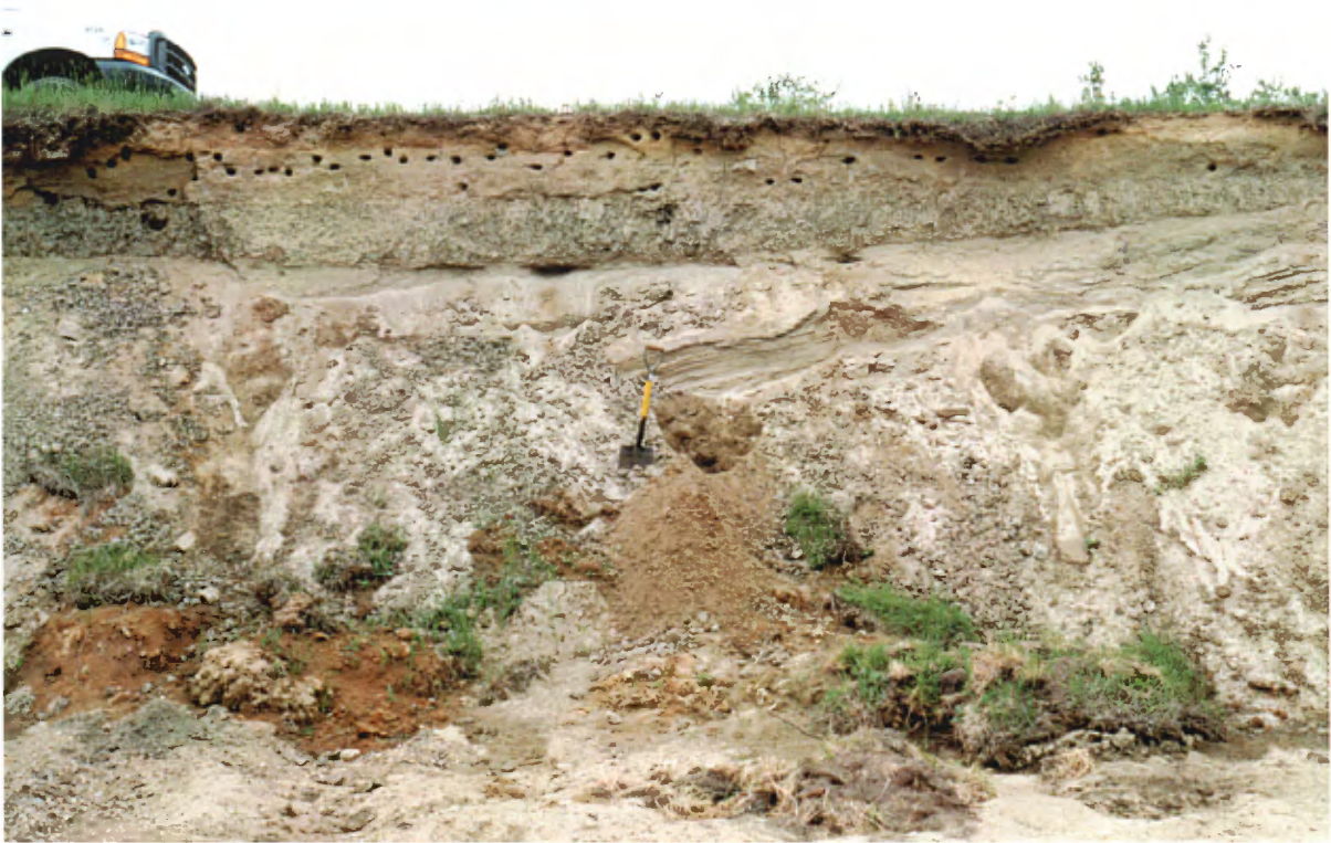
Photo 1 : Coupe formée de 2 à 3 m de sable fin à moyen propre et grossièrement stratifié recouvert de 0,5 à 1 m de sable silto-argileux (banc 3, gisement 1).