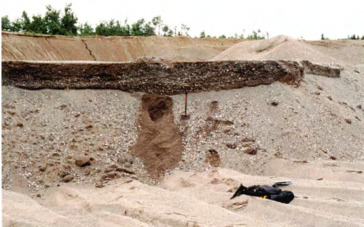
Photo 10 : Coupe de 2 à 3 m de hauteur, au plancher de l'exploitation, composée de sable moyen à grossier avec 20 à 40 % de gravier fin (banc 38, gisement 8).