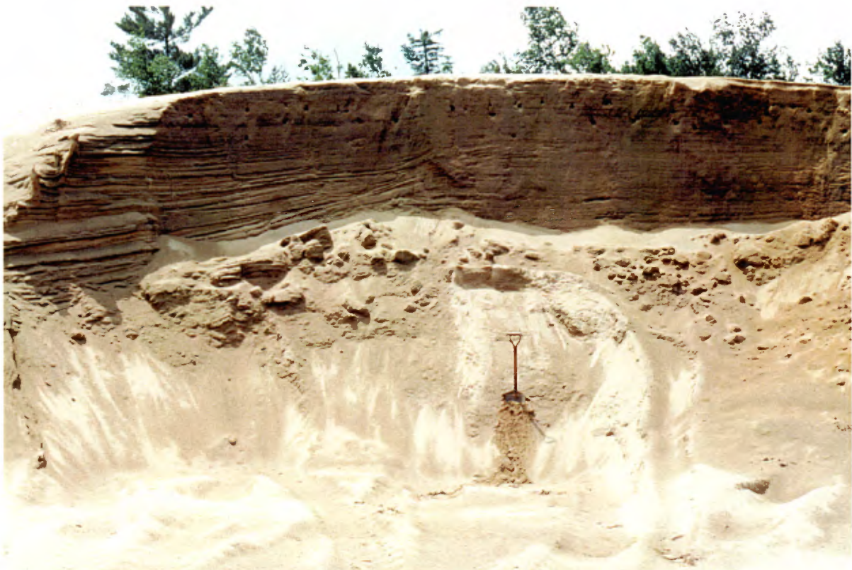
Photo 4 : Face de 4 à 5 m de hauteur composée de sable fin à moyen, propre et stratifié (banc 23, gisement 7).