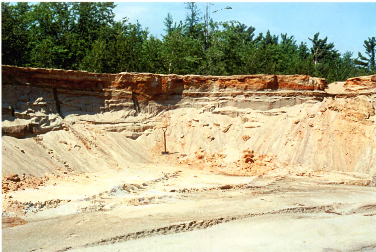
Photo 22 : Coupe de 2 à 3 m de hauteur dans un dépôt marin stratifié horizontalement. La coupe est formée de sable fin à moyen avec des interlits de sable silteux (banc 98, gisement 29).