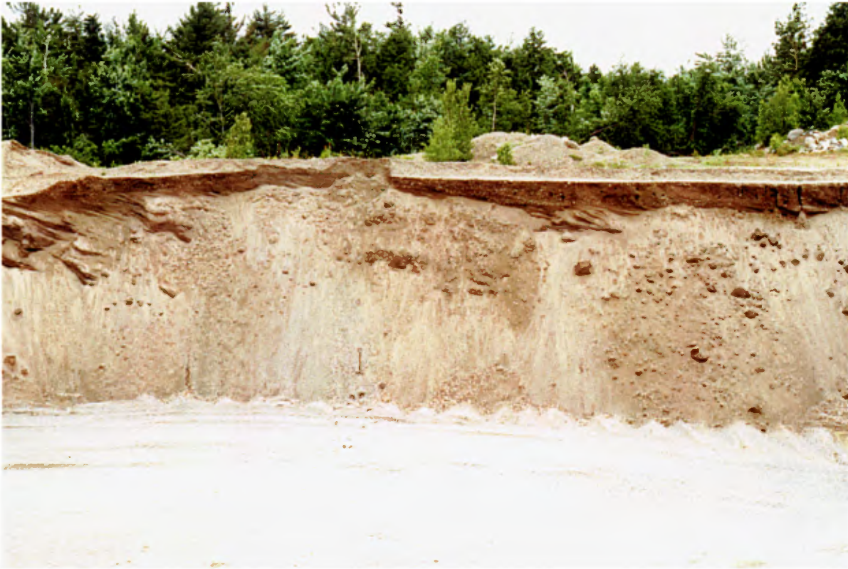
Photo 9 : Coupe effondrée de 6 à 7 m de hauteur, dans un dépôt deltaïque, formée de sable de granulométries diverses. Le dépôt est grossièrement stratifié (stratifications obliques). On peut observer en surface une petite couche de gravier fin (banc 38, gisement 8).