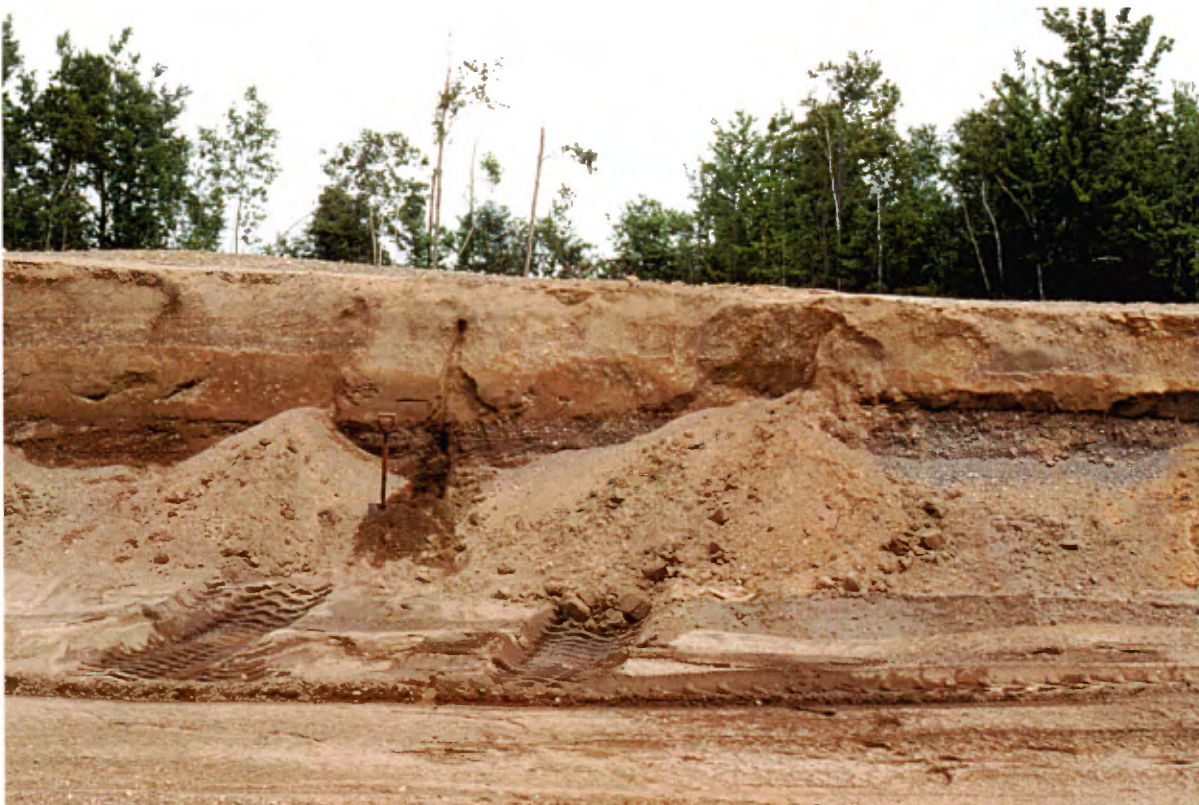
Photo 20 : Face de 2 à 3 m de hauteur composée de sable moyen à grossier avec 15 à 25 % de gravier. Ce dépôt fluvioglaciaire est grossièrement stratifié (banc 110, gisement 27).