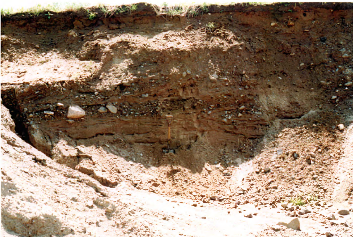
Photo 16 : Coupe de 3 à 5 m de hauteur, dans un dépôt fluvioglaciaire, constituée de 20 à 40 % de gravier avec quelques cailloux dans une matrice sableuse à sablo-silteuse. Les matériaux sont mal triés et la coupe présente des stratifications frustres. (banc 47, gisement 23).