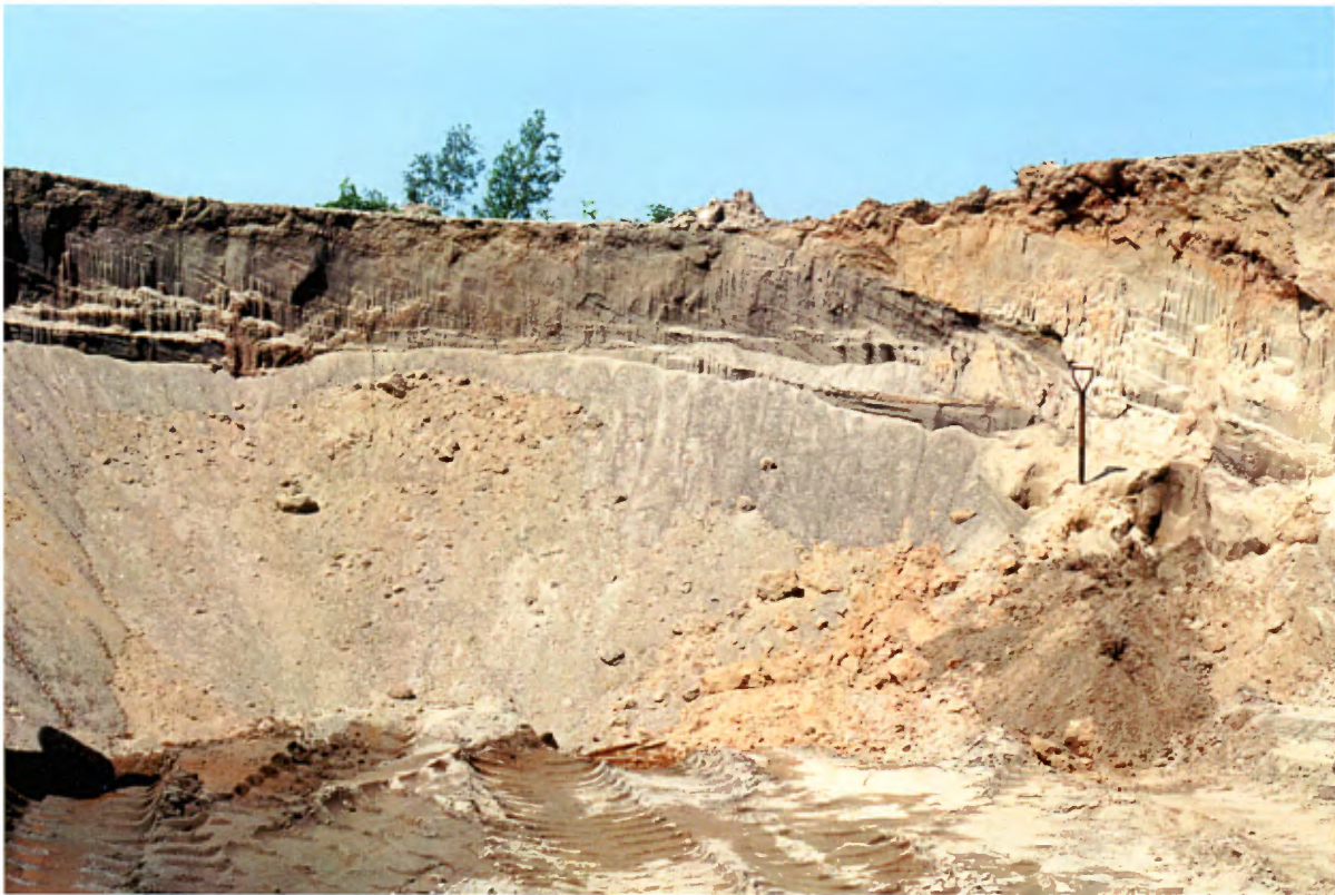
Photo 21 : Coupe de 3 à 4 m de hauteur, dans un dépôt fluvio-glaciaire. La coupe se compose surtout de sable moyen avec des interlits de sable grossier et d'autres de sable fin (banc 93, gisement 29).