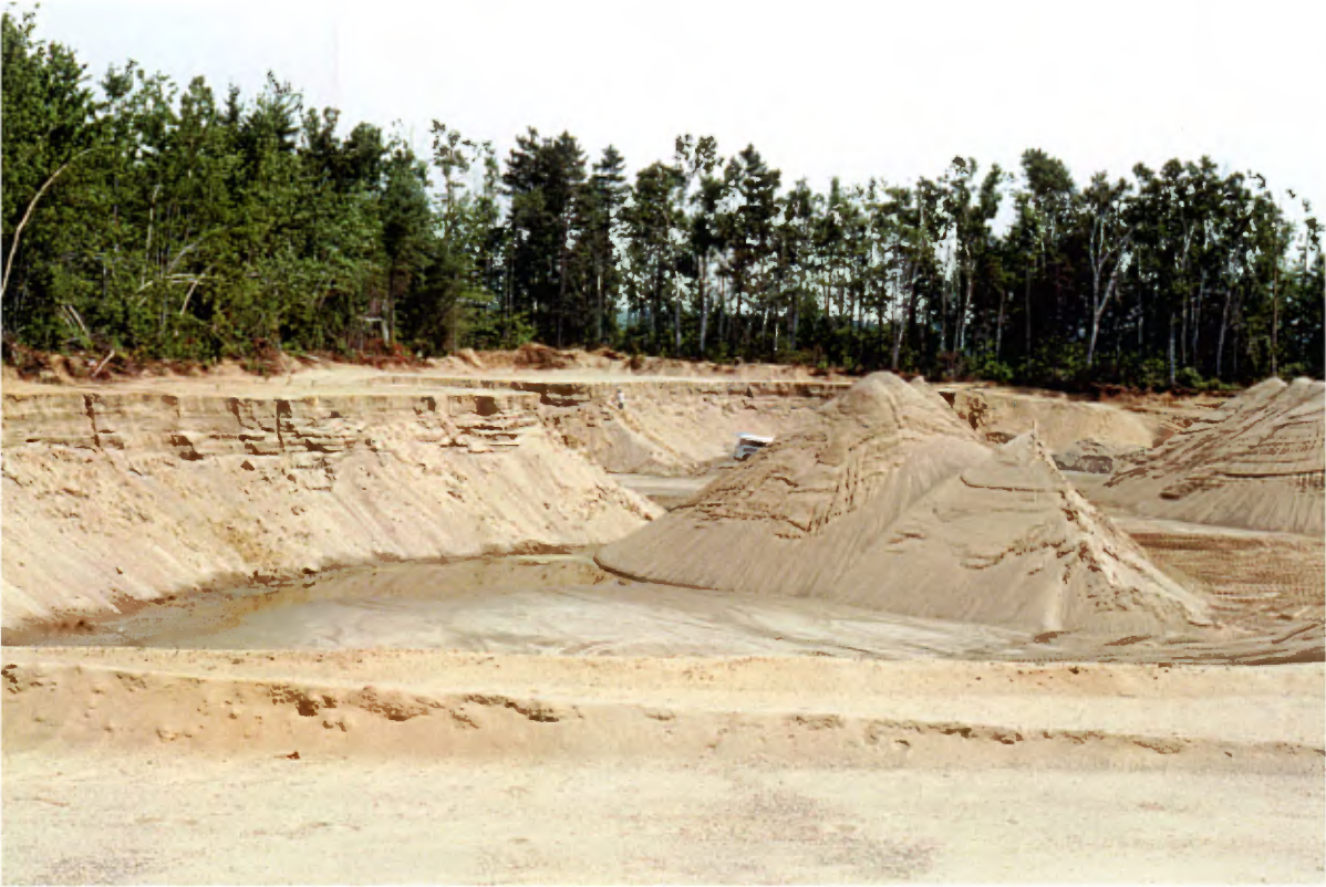
Photo 19 : Coupes de 5 à 7 m de hauteur dans un dépôt fluvioglaciaire à stratifications horizontales. Ces coupes sont composées surtout de sable moyen avec des interlits plus ou moins fréquents de sable fin, de sable grossier avec du gravier fin, et de sable silteux (banc 107, gisement 27).