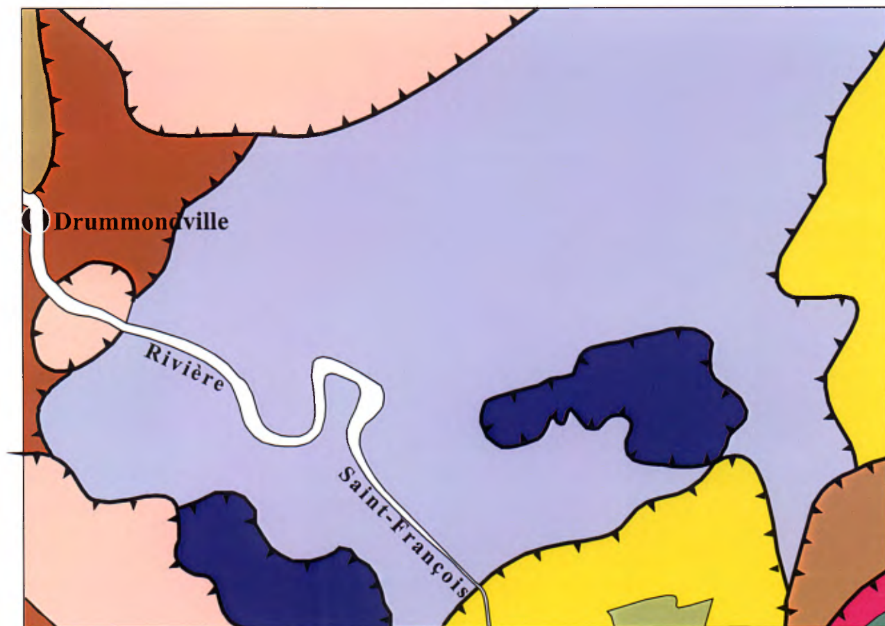
Figure 1 : Géologie de la région de Drummondville (Avramtchev 1994 et Slivitzky et St-Julien 1987)