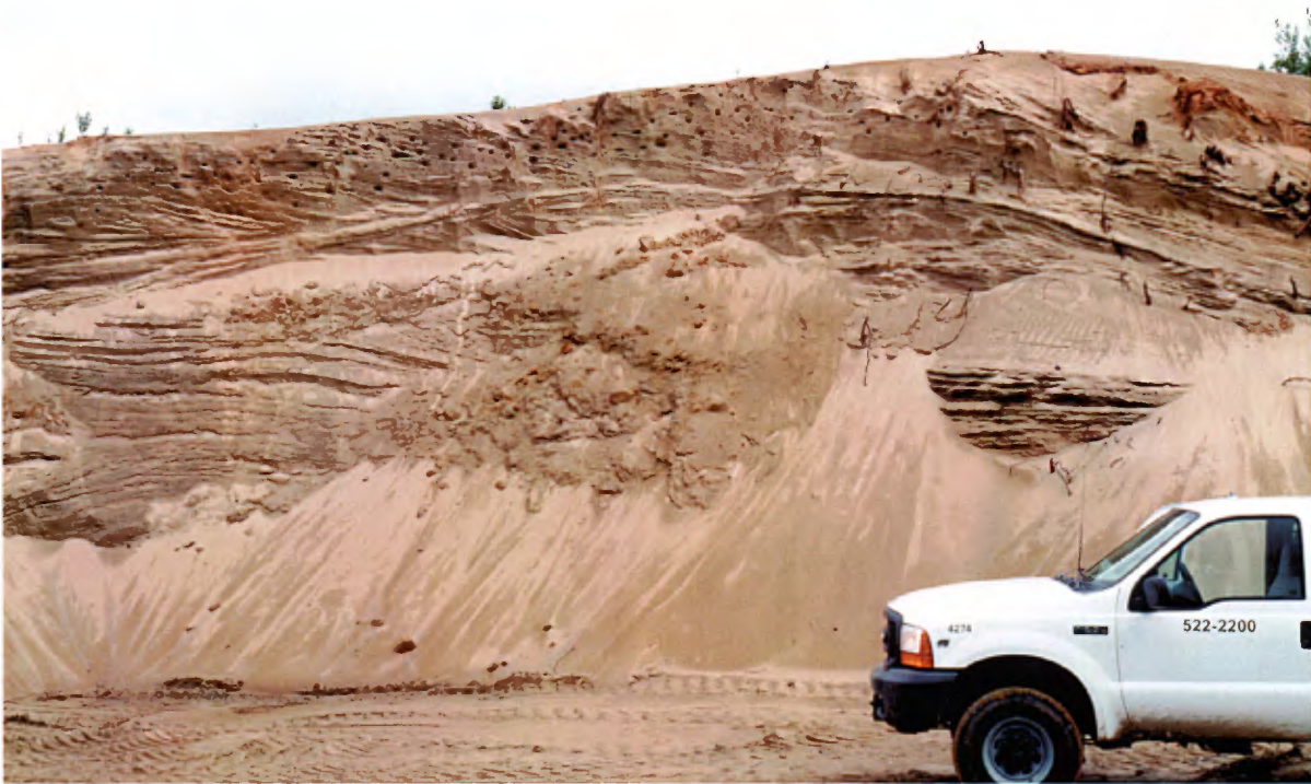
Photo 15 : Coupe de 5 à 6 m de hauteur dans une dune, composée de sable fin homogène avec de petits interlits silteux. Présence de stratifications horizontales et obliques (banc 53, gisement 19).