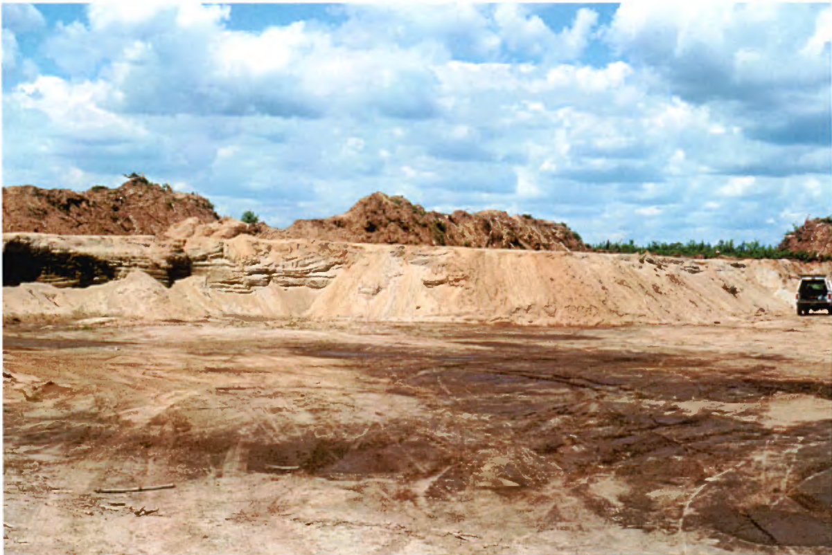
Photo 11 : Coupes de 3 à 4 m de hauteur, dans un dépôt deltaïque, composées de sable moyen à fin propre avec des interlits de sable grossier ou de sable silteux. Les stratifications sont horizontales à sub-horizontales (banc 78, gisement 10).