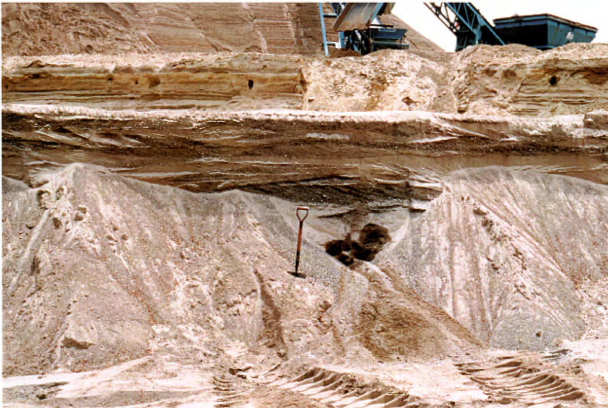
Photo 18 : Coupe, dans un dépôt fluvio-glaciaire, formée de 1 à 2 m de sable fin à moyen à stratifications horizontales reposant sur 2 à 3 m de sable moyen à grossier avec 5 à 15 % de gravier fin. La base de la coupe est caractérisée par la présence de stratifications entrecroisées et obliques (banc 115, gisement 26).