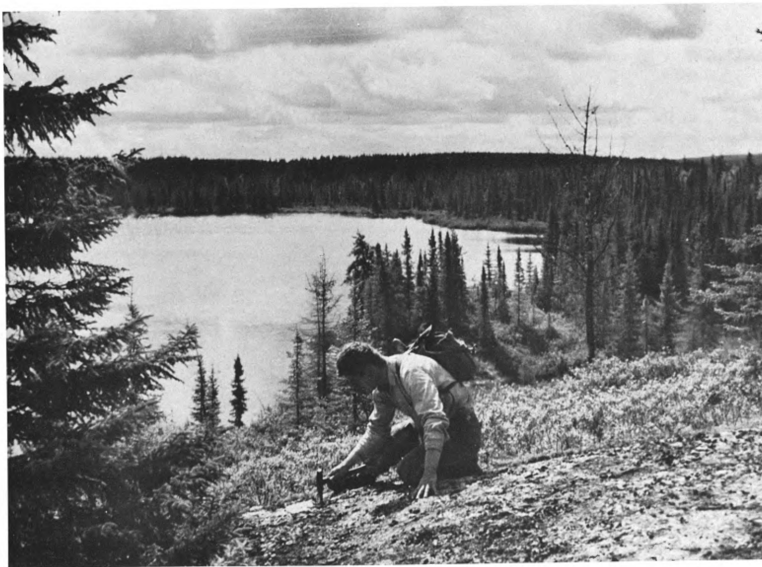
Géologue prélevant un échantillon de gneiss granitique près du lac Inconnu, canton de Rasles.