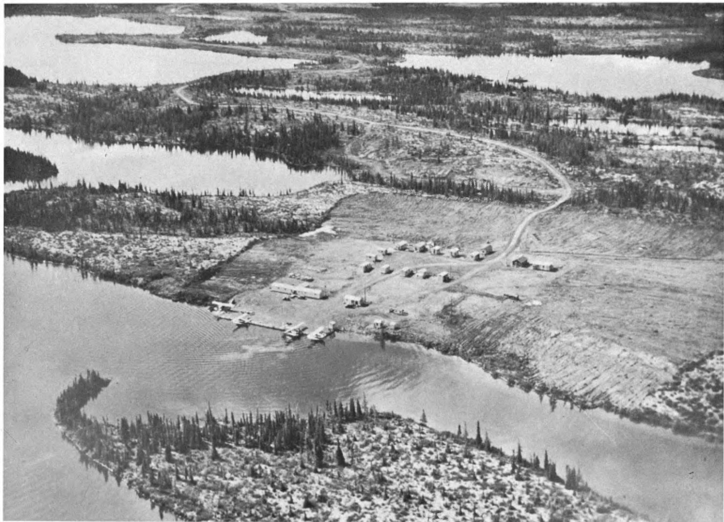
Base pour hydravions au bord du lac Squaw, Nouveau-Québec.