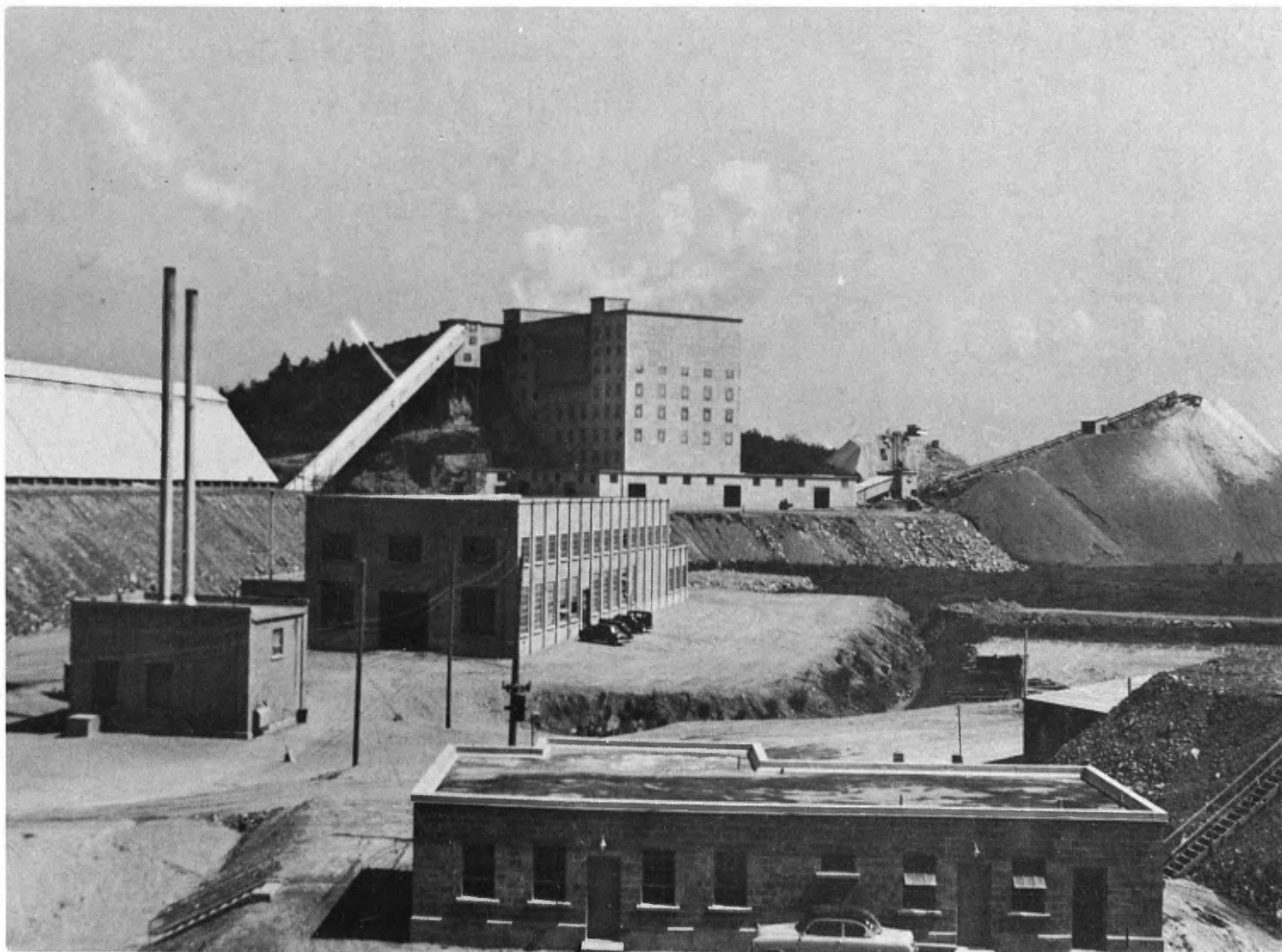
Nouvel atelier de traitement de Johnson's Asbestos Company à Mégantic, dans le canton de Coelraine .