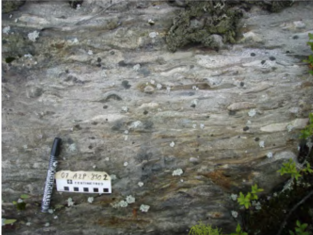
PHOTO 1 - Conglomérat polygénique de l'unité Apil1 de la Formation de Pilipas, le long de la Faille Sarcelle. Les fragments sont étirés dans des proportions pouvant atteindre 10:1.