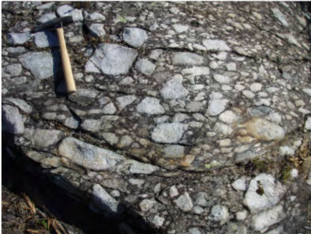
PHOTO 3 - Brèche hydrothermale monogénique à fragments anguleux de grès arkosique (unité Apil3, Formation de Pilipas).