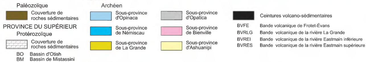
FIGURE 1 - Localisation et cadre géologique régional de la région cartographiée.