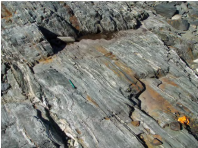
PHOTO 5 - Zones de sulfures disséminés dans des basaltes déformés de la Formation de Kasak, à quelques centaines de mètres à l'est de la Faille de Mistamiskwas.