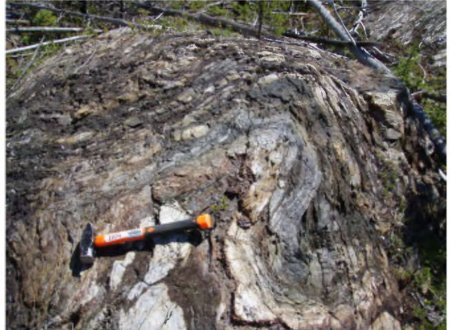
PHOTO 2 - Formation de fer montrant des niveaux rubanés, plissés et rouillés (unité Apil2, Formation de Pilipas).