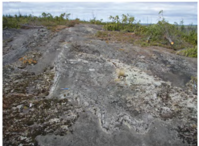
PHOTO 6 - Veines métasomatiques, plissées dans des roches sédimentaires altérées (unité Apil3, Formation de Pilipas).